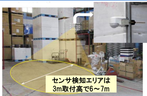
センサ検知エリアは 3m取付高で6~7m